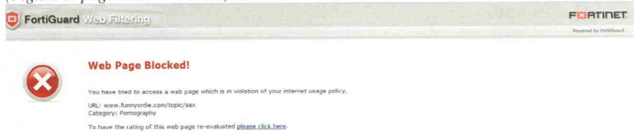
(Figura 1: pagina web bloccata)

L'accesso è, invece, parzialmente limitato ai siti non classificati e a quelli che comportano un alto consumo di banda (download, TV, Radio, ecc), come segnalato da apposito "warning", nella seguente finestra di allerta.