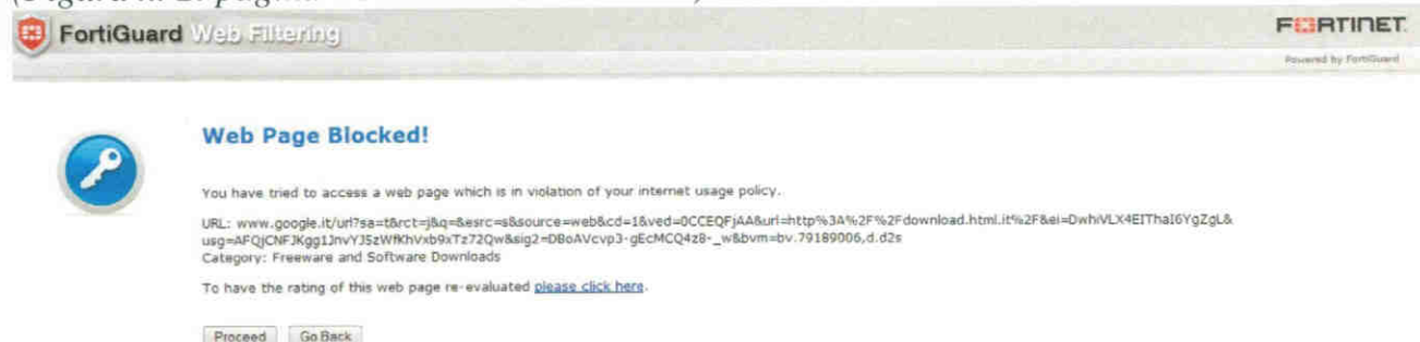
(Figura n. 2: pagina web ad accesso limitato)

In quest'ultimo caso si specifica che gli utenti potranno procedere nella navigazione facendo click sull'apposito tasto "Proceed" assumendo personalmente la responsabilità dell'azione e avendo la consapevolezza che il mancato rispetto o la violazione delle norme contenute nel suddetto Regolamento è perseguibile con provvedimenti disciplinari, nonché con le azioni civili e penali consentite.